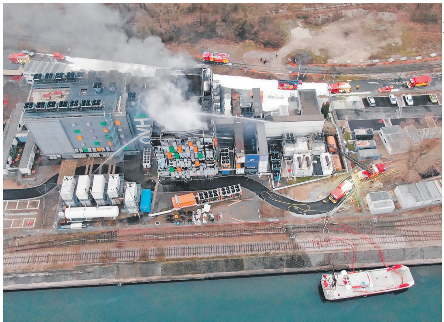
Le «cloud» parti en fumée. L'incendie qui a frappé le centre de données d'OVH à Strasbourg a bloqué plusieurs sites web suisses. En réaction, les sites en Suisse ont vérifié leurs dispositifs anti-feu pour prévenir un accident qualifié de «très rare» par Infomaniak. PAGES 5 ET 18