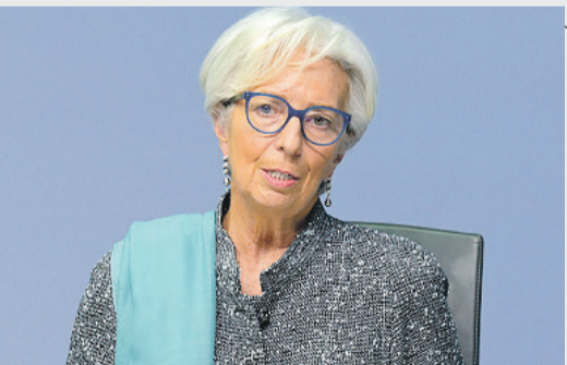
Christine Lagarde. «Les taux d'intérêt ont augmenté sur les marchés, ce qui pose un risque pour les conditions de financement» de l'économie, a affirmé jeudi la présidente de la Banque centrale européenne. PAGE 12