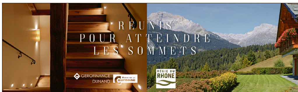
Une nouvelle ligne de communication marque l'événement.

- Être le numéro un, je le répète, n'a jamais fait partie de mes objectifs. Je ne me suis jamais réveillé le matin en me disant: «Je veux diriger le plus important groupe de régies de Suisse romande». Jamais! Mais il est vrai que d'être à la tête d'une entreprise qui fonctionne bien, qui croît de façon raisonnable année après année, mais qui surtout continue à offrir à ses clients un service de qualité, me réjouit pleinement. Je suis également très heureux que les collaborateurs de ces sociétés évoluent dans un environnement de travail stable, stimulant, et qu'ils bénéficient d'un bel avenir.